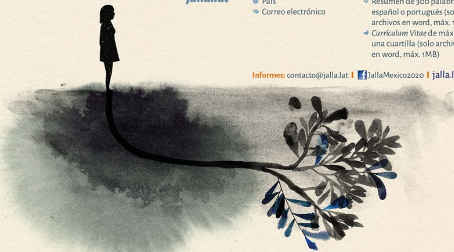
Ilustración original: Antología de Poetas Americanos Editorial Planeta, México 2018, cortesía de Amanda Millarjos / Artista e Ilustradora (México) Diseño: Amalia Corripio Vázquez

Informes: contacto@jalla.lat | jallaMexico2020 | jalla.lat